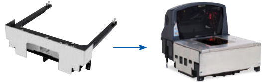
▶ Scale kit for Magellan8400